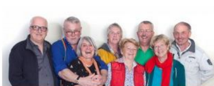
Modul des Monats September: Treffpunkt für ältere Homosexuelle