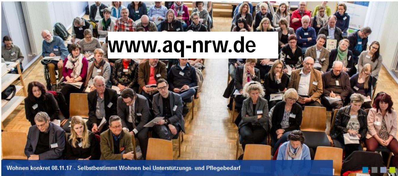
Wohnen konkret 08.11.17 - Selbstbestimmt Wohnen bei Unterstützungs- und Pflegebedarf