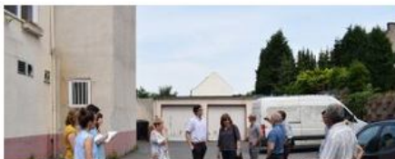
Praxiswerkstatt: Sozialer Isolation in der Quartiersarbeit begegnen