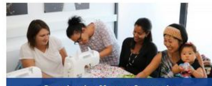
Quartier des Monats September: Quartiersentwicklung in Feldmark/Bocholt